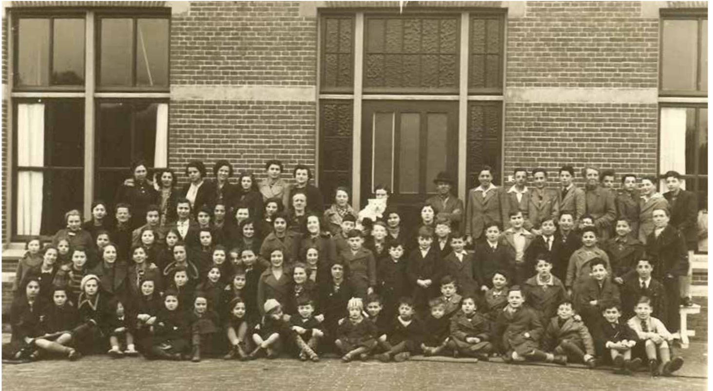
Vluchtelingenkinderen in Het Zeehuis.

Duitsers in mei 1940 ons land binnenvielen. Achteraf gezien heeft het gebrek aan barmhartigheid levens gespaard. Maar dat kon niemand in 1938 voorzien. De hoop en verwachting was immers dat, mocht er oorlog uitbreken in Europa, Nederland net als tijdens de 'Grote Oorlog' (1914-1918) neutraal zou blijven.